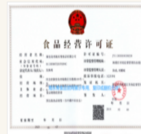
海东青食品经营许可证