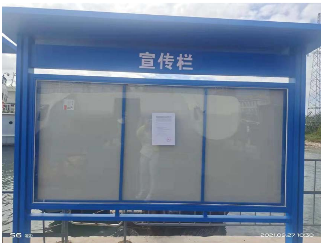
图 5 征求意见稿张贴公示照片

根据《环境影响评价公众参与办法》本项目环境影响评价不在公众参与简化范畴，需要进行张贴公示。征求意见稿应通过在建设项目所在地公众易于知悉的场所张贴公告的方式公开，且持续公开期限不得少于 10 个工作日。本项目于 2021 年 9 月 27 日至 2021 年 10 月 20 日在秦皇岛渔港渔轮码头港区张贴公告。