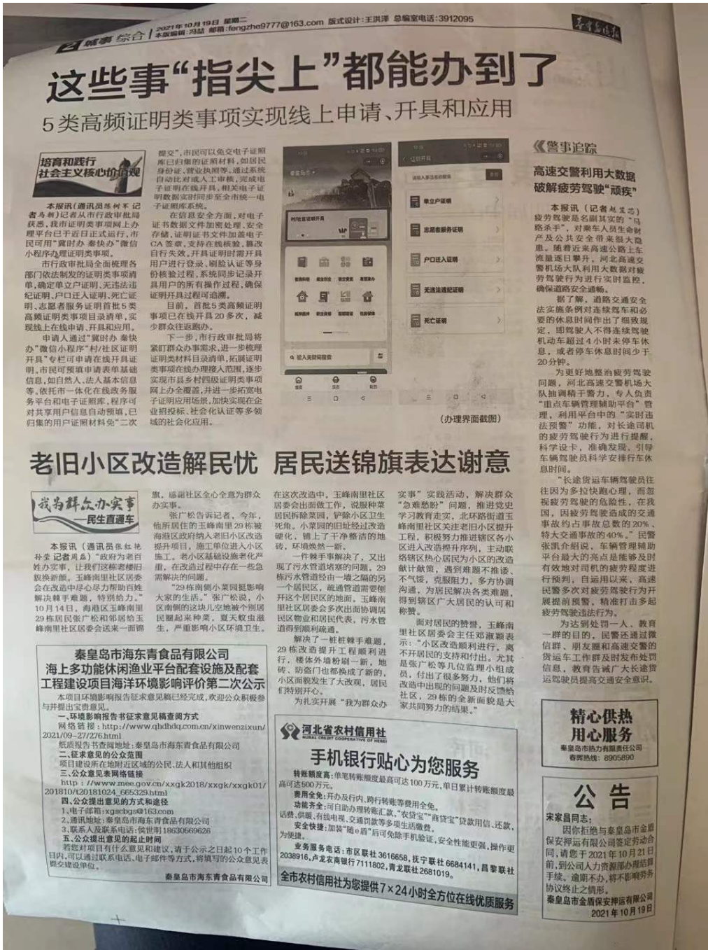
图3 征求意见稿报纸公示照片